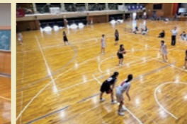
女子バスケットボール部