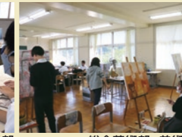
総合芸術部・美術班