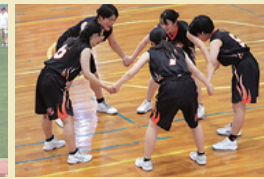
女子バスケットボール