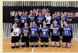
女子バレーボール