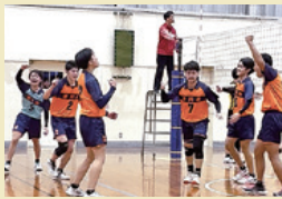
男子バレーボール