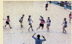
女子ハンドボール